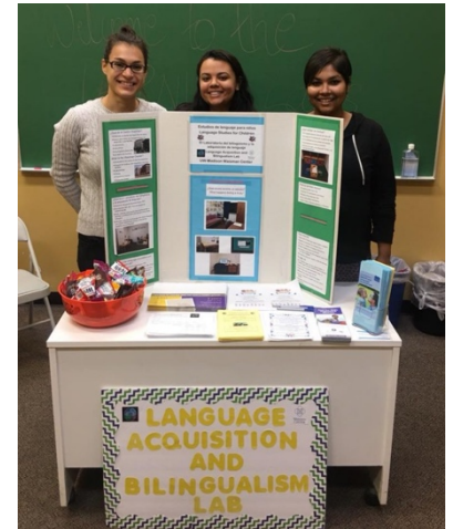
Miembros del laboratorio presentando un puesto de información.

Estamos reclutando hablantes bilingües de inglés y español. Si le interesa, por favor, envíenos un mensaje a uwbilingualism@waisman.wisc.edu o llámenos al (608) 263-5764.